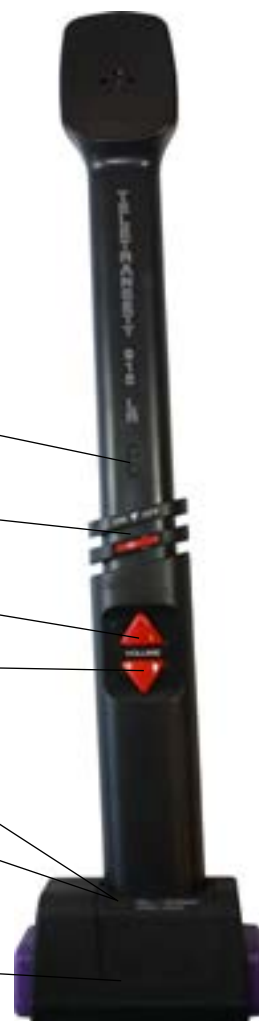
Hörstaven i laddställ

CE Frågor rörande EU:s medicintekniska direktiv 93/42/EEC hänvisas till AB Transistor Sweden.