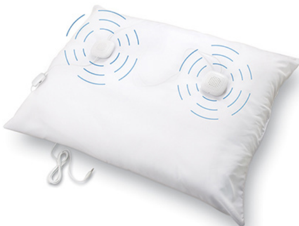
Art nr 110151